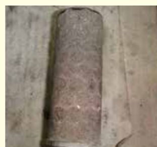
真空ポンプストレーナー ゴミ詰まりによる吸水不能