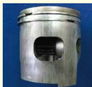
オイル不良 ピストンの異常磨耗 (全周に縦キズあり)